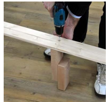
Bild 1: schrauben Sie den Auflagewinkel in der entsprechenden Höhe an das Kopf- bzw. Fußteil

Bild 2: legen Sie die Mittelstütze auf die beiden Winkel