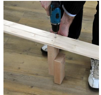
Bild 1: schrauben Sie den Auflagewinkel in der entsprechenden Höhe an das Kopf- bzw. Fußteil

Bild 2: legen Sie die Mittelstütze auf die beiden Winkel